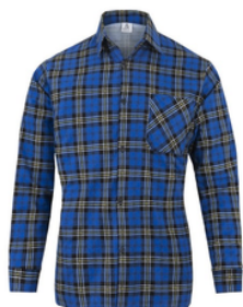
niebieski szkocka krata